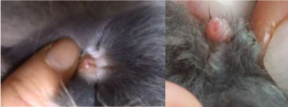
Foto links: Een voedster heeft een U vorming geslacht, een spleetje tot de anus. Foto rechts: Een rammelaar heeft een rondje, soms met opstaande rand, de opening loopt niet door tot de rand.

Konijnen staan bekend om hun snelle voortplanting. Vanaf drie maanden is een konijn al geslachtsrijp. Ze zijn het hele jaar door vruchtbaar en kunnen per jaar wel vier tot zeven keer werpen. Wil je ongewenste nesten vermijden, laat de rammelaar dan castreren. Dat kan vanaf drie maanden. De voedster kan vanaf zes maanden gesteriliseerd worden. Het is aanbevolen om een voedster te laten steriliseren, om baarmoederkanker te voorkomen.