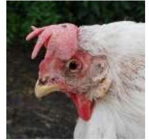
Kip aangetast door pokken.

Bij legnood is er een ei aanwezig, maar kan de kip dit niet leggen. Indien deze situatie te lang duurt, kan de kip overlijden. Neem steeds contact op met een dierenarts. Een evenwichtige voeding en voldoende calcium is belangrijk om legnood te voorkomen.