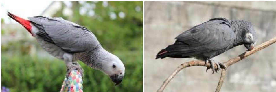
Links de gewone grijze roodstaart, rechts de Timneh grijze roodstaart.

Er zijn twee soorten van de grijze roodstaartpapegaai, nl. de gewone grijze roodstaartpapegaai ( Psittacus erithacus ) en de Timneh grijze roodstaartpapegaai ( Psittacus timneh ). Vroeger werden deze als ondersoorten beschouwd en werd de gewone grijze roodstaartpapegaai ook wel de Congolese grijze roodstaartpapegaai of Congo grijze roodstaartpapegaai genoemd. De gewone grijze roodstaart heeft grijze veren, een zwarte snavel en een felrode staart. Deze soort is het meest gehouden in gevangenschap. De Timneh grijze roodstaart is kleiner en heeft een donkergrijze met bruin-roze snavel en een oranje-bruine staart.